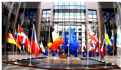
A Tanács épülete Brüsszelben.

E-mail formátum: keresztnev.csaladnev@consilium.europa.eu