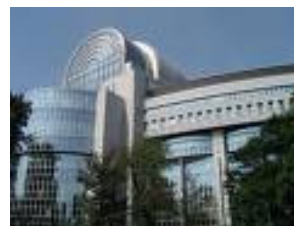
A Parlament brüsszeli épülete.

Európai Parlament 60 rue Wiertz B-1047Brüsszel www.europarl.europa.eu