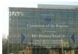
A Régiók Bizottságának és az Európai gazdasági és szociális bizottságnak az épülete Brüsszelben.